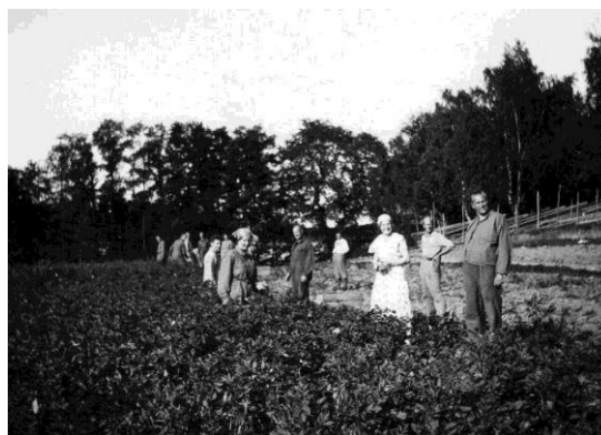
Potatisplockning. Bra träning för tävlingarna?