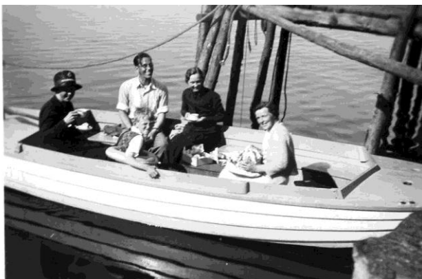
Båt till utposter