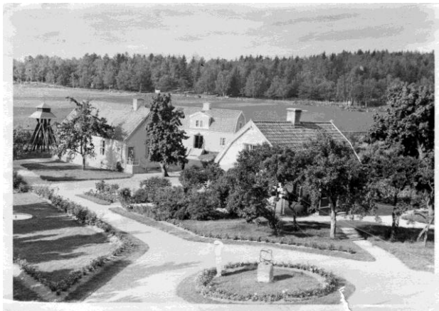
Några av husen på Kurön