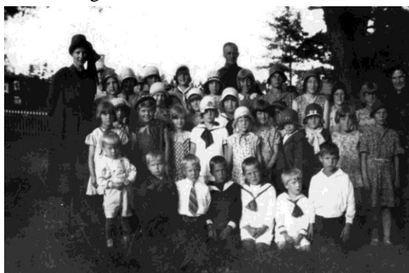
Fotot Söndagsskolans barn